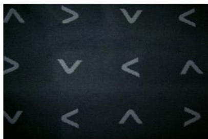
F1001/131 - F1001/132